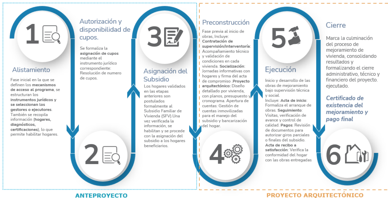
Ilustración 5 | Etapas del programa – Elaboración Propia

En ese sentido, se prevé el despliegue de mecanismos específicos de asistencia técnica según el momento del ciclo: durante el alistamiento (para preparación normativa e institucional), durante la postulación (para facilitar el diligenciamiento de requisitos), durante la ejecución (para el soporte técnico de las intervenciones) y durante el cierre (para apoyar la legalización, certificación y evaluación del proceso).