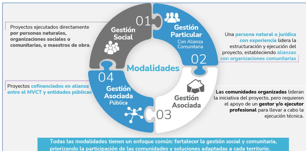
Ilustración 1 | Modalidades del mejoramiento de vivienda – Elaboración propia partir de Decreto 0413 de 2025