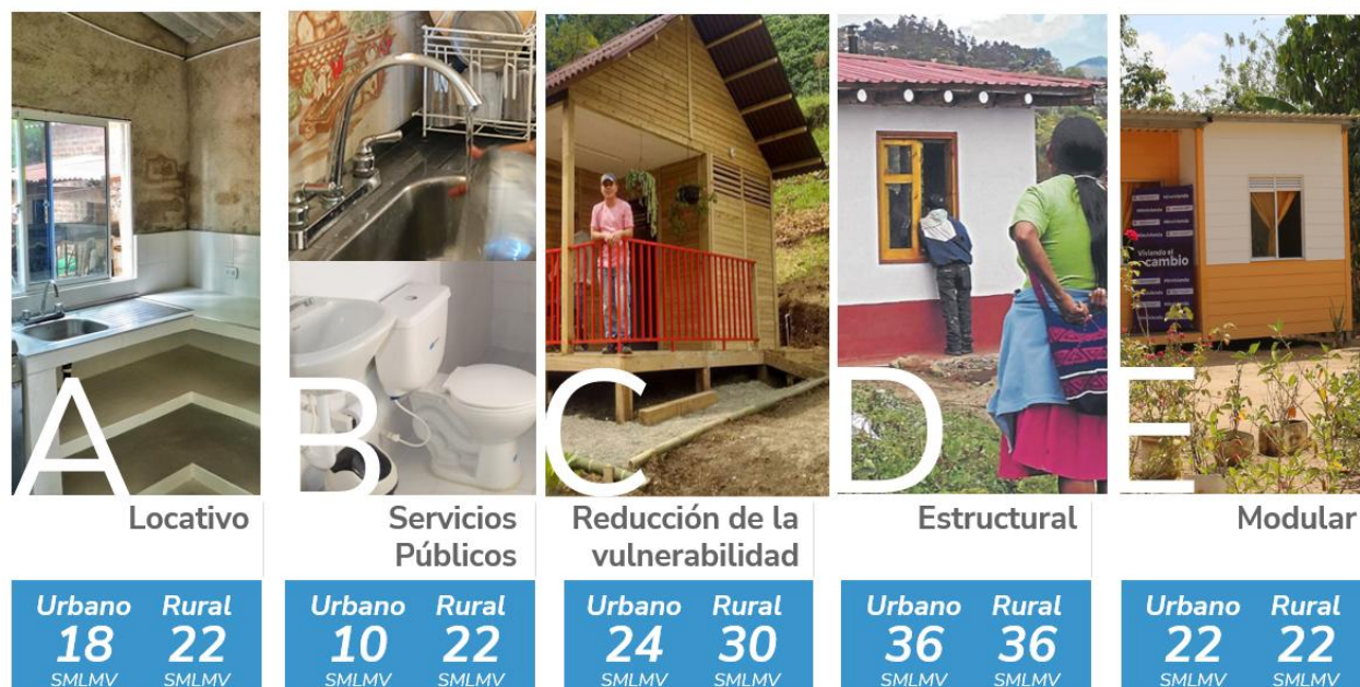
Ilustración 3 | Topes, categorías y tipos de intervención – Elaboración Propia Fuente: Decreto 013 de 2025.

Estos montos corresponden a los topes máximos del valor total del subsidio y deberán reflejarse en el presupuesto y proyecto arquitectónico elaborado para cada caso. En ningún caso el valor asignado podrá ser superior al tope máximo estipulado por categoría, sin perjuicio del reconocimiento del incremento por transporte en zonas rurales de difícil acceso, el cual será adicional al subsidio básico y deberá justificarse debidamente con soporte técnico.