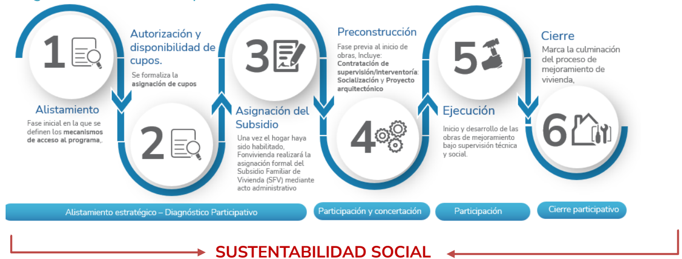
Ilustración 5 | Relación entre la operación de las modalidades y la Asistencia Técnica Integral – Elaboración Propia

En este sentido, se construye como base la Asistencia Técnica Integral, que implementa acciones diferenciadas que responden a las necesidades de cada modalidad en materia de acompañamiento y asistencia técnica, especialmente orientada a organizaciones sociales y comunidades. La estrategia supera la asistencia como una acción puntual, para darle lugar a comprender la asistencia como un proceso continuo que potencia el diálogo técnico, social y organizativo en función de los principios de integralidad, corresponsabilidad y participación.